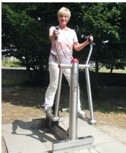
Sport- und Bewegungsangebot des Seniorenrates

Bewegungsparcours Edigheim südlich Sportplatz Edigheim